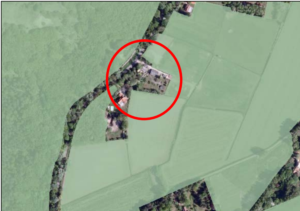
Figuur 4. EHS-gebieden rond het plangebied (groen)

Ten westen van het plangebied ligt het Natura 2000-gebied 'Noordhollands Duinreservaat'. Ten oosten liggen weidegebieden, welke deel uitmaken van de Ecologische Hoofdstructuur. Het perceel grens direct aan de EHS-gebieden (zie onderstaand figuur). Een klein gedeelte van het plangebied maakt deel uit van de EHS.