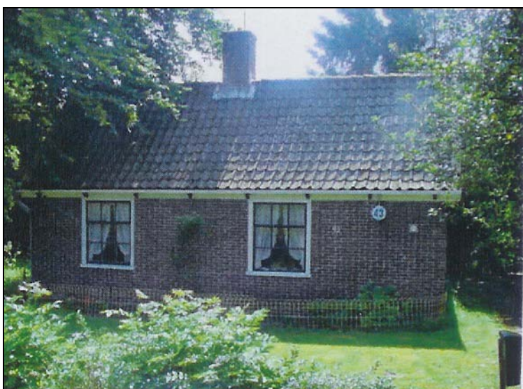
Figuur 3. Aanzicht oorspronkelijke bedrijfswoning

In de bestaande situatie is er een aantal verschillende gebouwen op het perceel aanwezig. De karakteristieke woning, die relatief dicht op de Herenweg staat, is vrij klein (zie onderstaande afbeelding voor een foto van de woning). De woning, uit ongeveer 1915, heeft een vloeroppervlak van ongeveer 75 m 2 . Dergelijke oppervlaktes waren voor kleinschalige agrarische bedrijven gebruikelijk. Als aanvulling op het inkomen werd de woning in de zomer vaak verhuurd. De eigenaren gingen, wat gebruikelijk was in deze streek, wonen in de schuur. Hier zijn in de loop der tijd woonruimten (slaapkamers, wasgelegenheid, etc.) gerealiseerd. De schuurruimte heeft een totale oppervlakte van ongeveer 120 m 2 . Tot slot is, als extra aanvulling op de agrarische inkomsten, een recreatiewoning gebouwd achter op het erf.