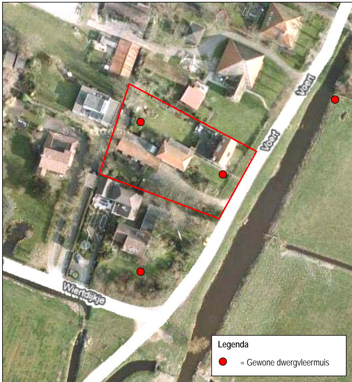
Figuur 4. Foerageerplaatsen van vleermuizen in de herfst in en rondom het herbestemmingsgebied aan De Voert 10 te Bergen.

Er zijn in de herfst alleen gewone dwergvleermuizen aangetroffen. Er werden enkele foeragerende dieren gelokaliseerd. Er zijn geen balts- en / of paarplaatsen aangetroffen. In figuur 4 worden de waarnemingen weergegeven.