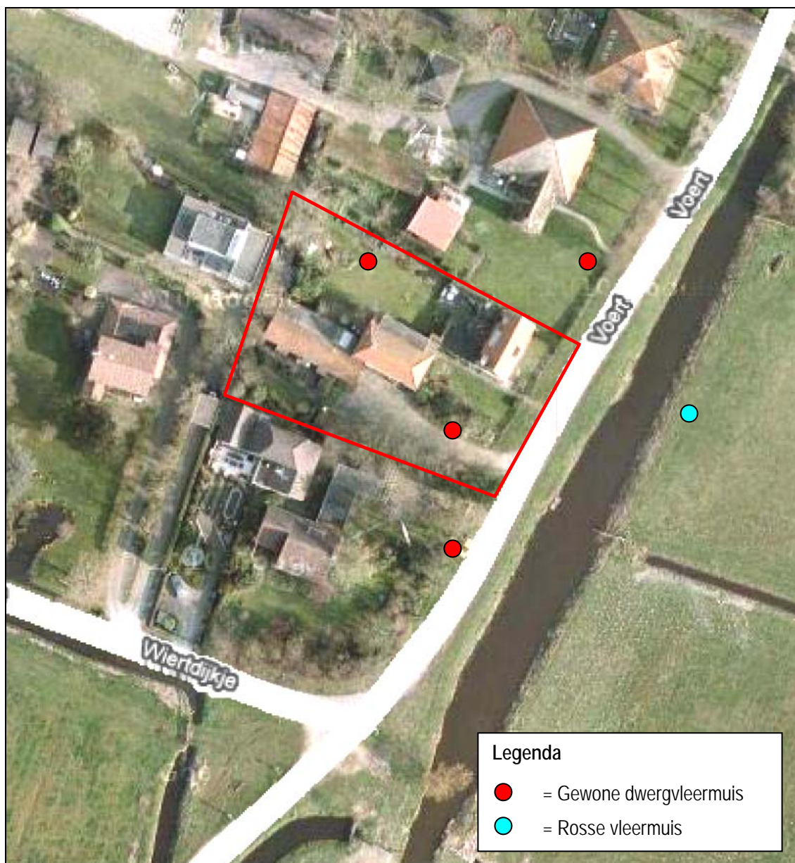
Figuur 3. Foerageerplaatsen van vleermuizen in de voorzomer in en rondom het herbestedingsgebied aan De Voert 10 te Bergen.

In totaal zijn twee vleermuissoorten vastgesteld. Het betreft de gewone dwergvleermuis en rosse vleermuis. Beide soorten werden in relatief lage dichtheid foeragerend vastgesteld. Er zijn geen aanwijzingen gevonden van het voorkomen van kolonies of vliegroutes. Daarbij komt dat de rosse vleermuis uitsluitend boombewonend is en derhalve geen verblijfplaatsen kan hebben in het herbestedingsgebied. In figuur 3 worden de foerageerplaatsen weergegeven.